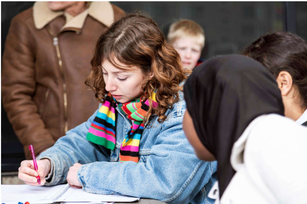
In Amersfoort tellen alle kinderen mee.