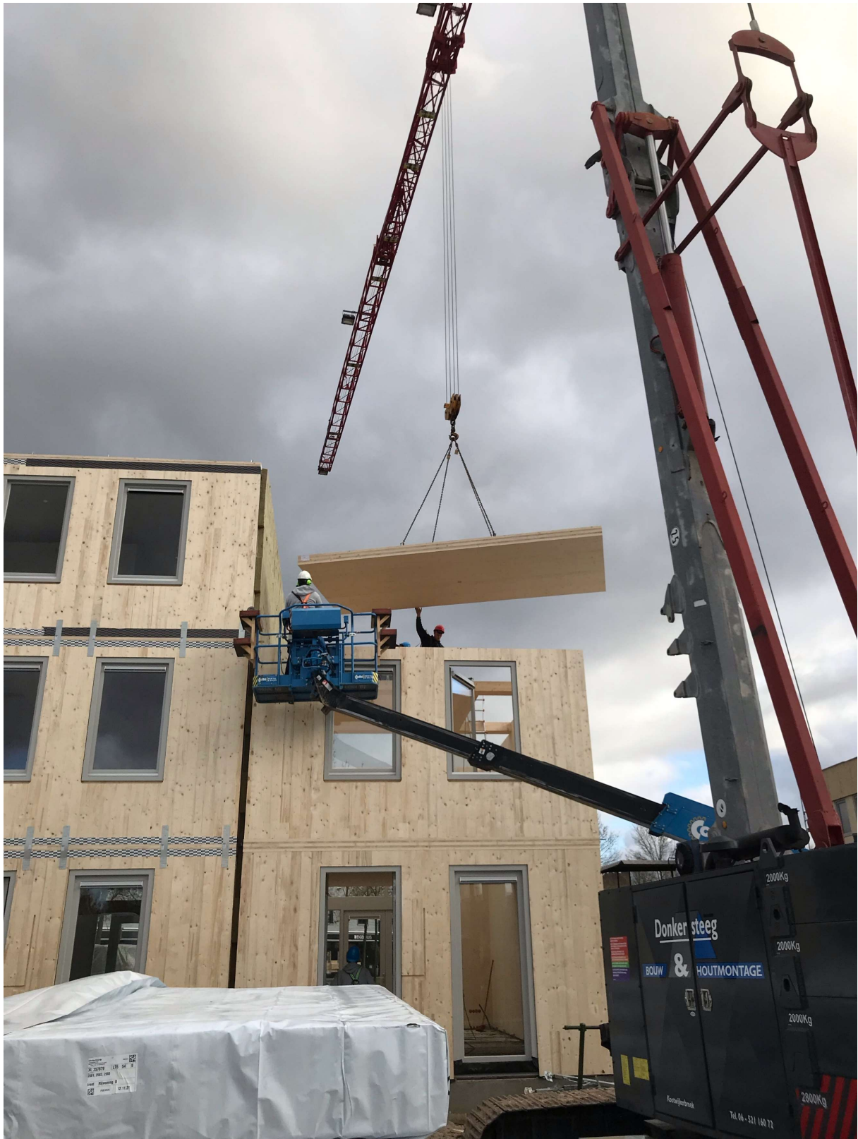
Deze huizen aan de Laan van Duurzaamheid in Nieuwland zijn van hout.