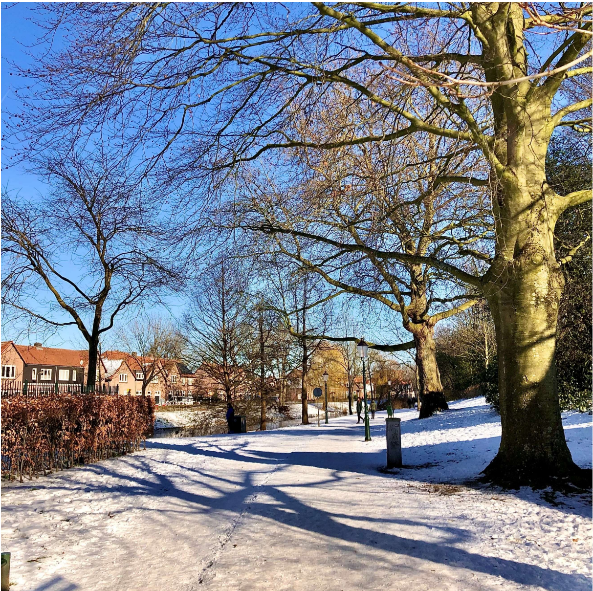
Het plantsoen om de binnenstad is een rustig groen wandelgebied in de drukke stad.