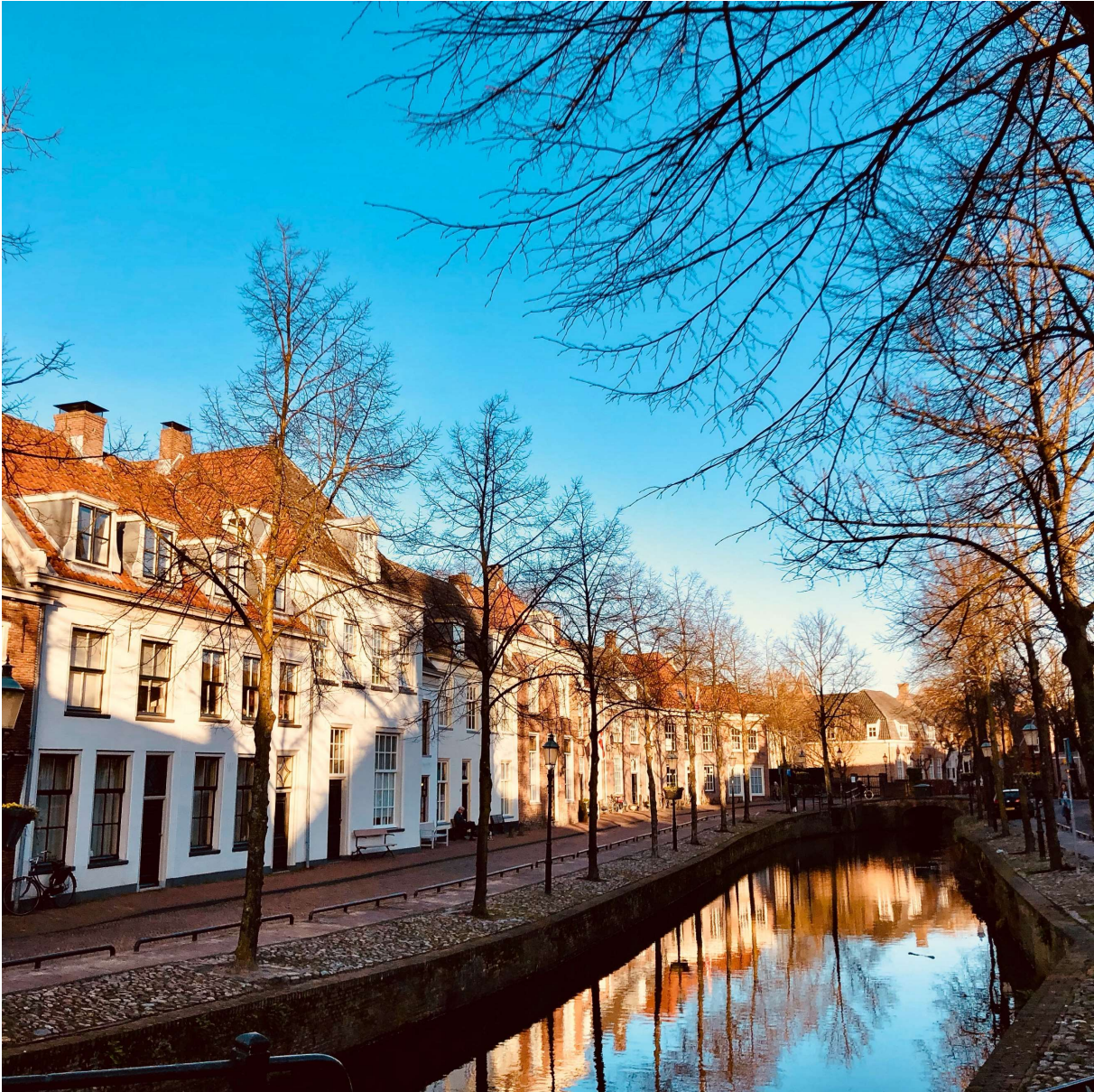
Geen parkeerplaatsen meer op het Havik.