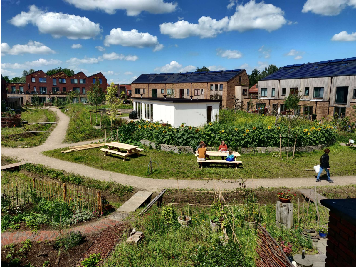
Een groep inwoners heeft samen Soesterhof gebouwd.