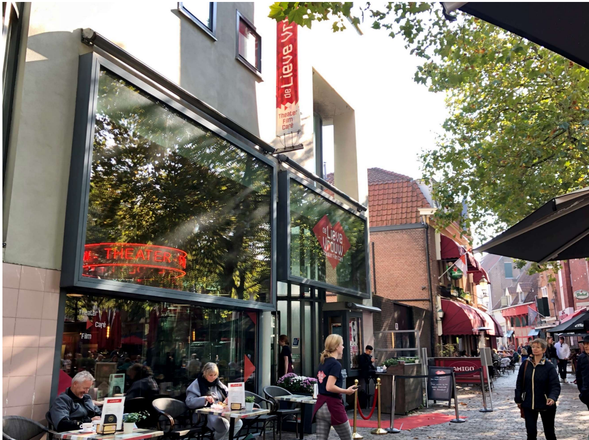
Theater De Lieve Vrouw heeft films en toneelstukken. Ook voor kinderen.